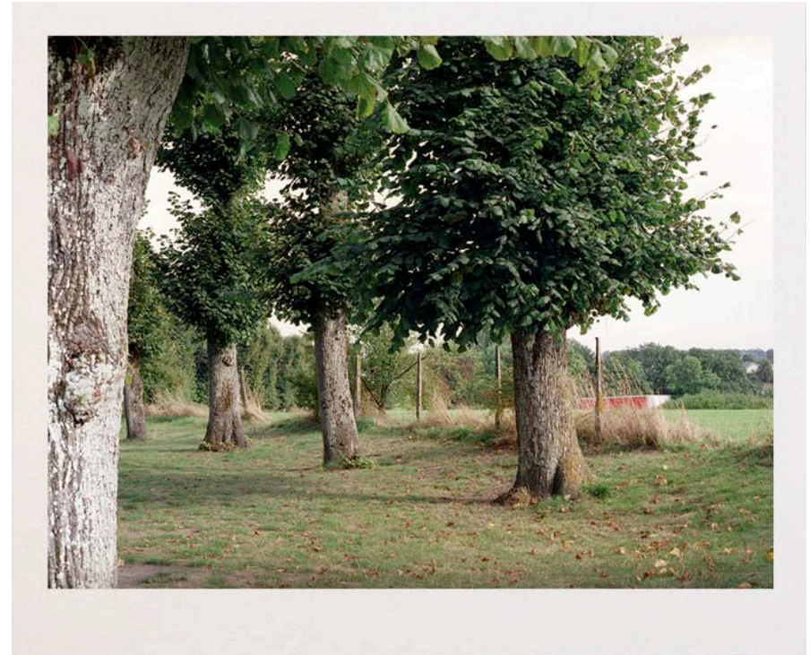
(2) Muriel Joya, extrait de la série De la rivière sainte au lieu dit , 2008-tirage numérique contrecollé, 28 x 34 cm

« Cette idée de filtre m'intéresse dans la pratique sous la forme de l'écran où se projettent les peurs, les fantasmes... où une image en révèle d'autres : les images mentales. L'écran est un passage, une frontière entre occultation et révélation, matériel et immatériel, physique et métaphysique. Quoi qu'il en soit, il fait barrage au regard, obstrue l'infini. Ce dispositif pousse le regard à circuler dans l'image, sans toutefois qu'il puisse fuir. En créant ce mur, l'image renvoie à d'autres infinis, l'écran nous permet d'accéder à un contenu sous-jacent. D'abord obstacle, il révèle ensuite l'image. »