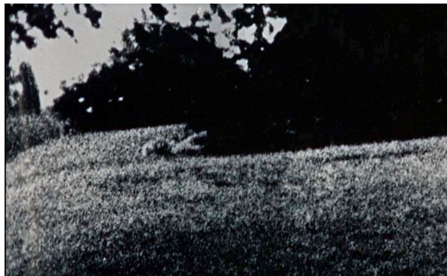
Michelangelo Antonioni, image tirée du film Blow up , 1966 directeur de la photographie Carlo di Palma